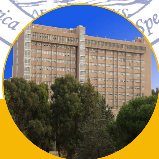
Ospedale S. Eugenio

Venti anni di Trapianti di Fegato del POIT