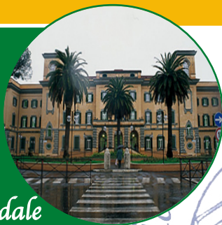
Ospedale S. Camillo