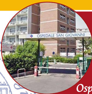
Ospedale S. Giovanni